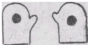
Рис. 1. Тренажер «Солнышко»

Для изготовления тренажера нужен материал темного цвета, из которого шьются две рукавички. Из желтой, красной или оранжевой материи вырезаются два кружка размером 4-5 см. Они нашиваются в центр ладонной поверхности рукавичек снаружи.