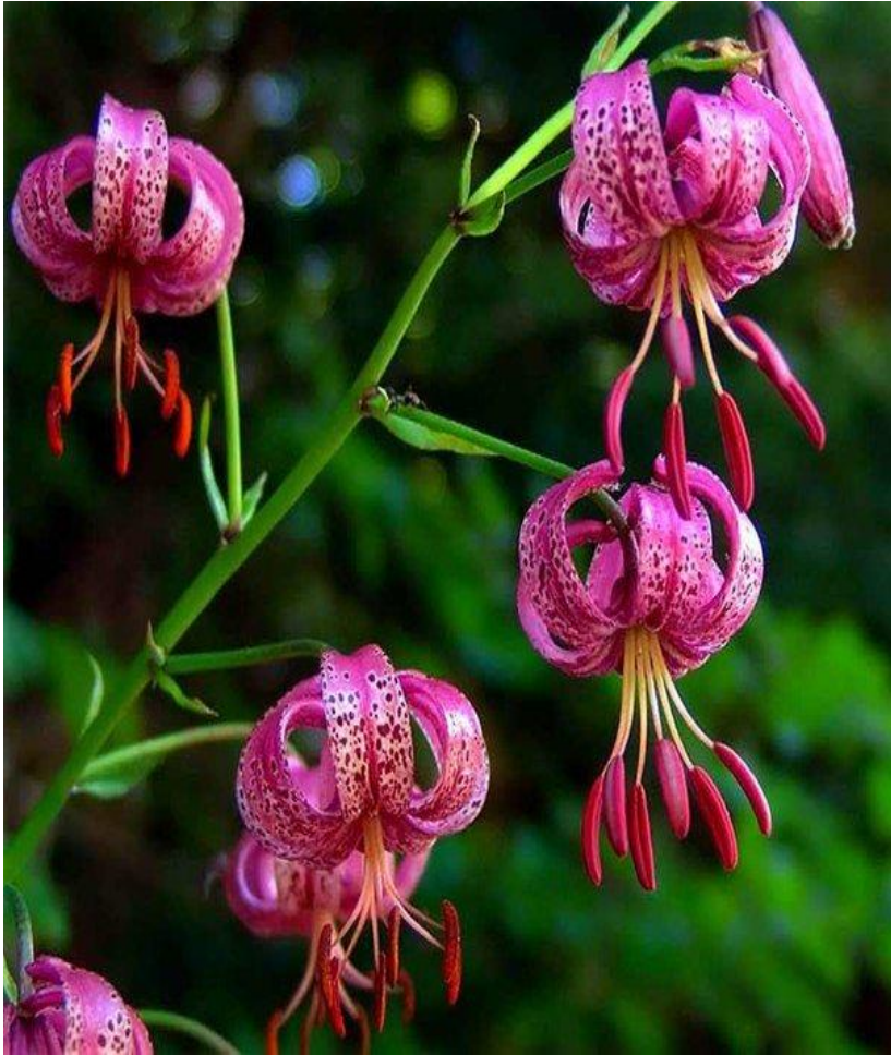
Лилия волосистая (саранка)